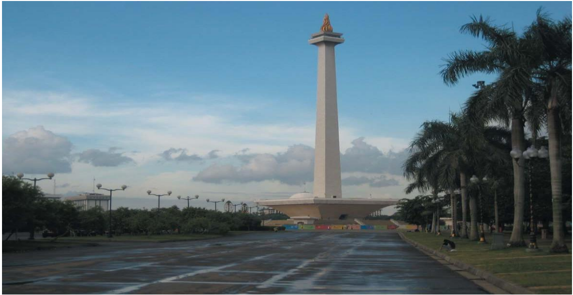
印尼独立纪念碑广场

印尼实行总统制，总统既是国家元首，也是政府首脑，同时掌管三军。总统、副总统均由全民直选产生，任期5年，总统可连任一次。现任总统为佐科·维多多，副总统为马鲁夫·阿敏，本届内阁于2019年10月组建，任期至2024年。