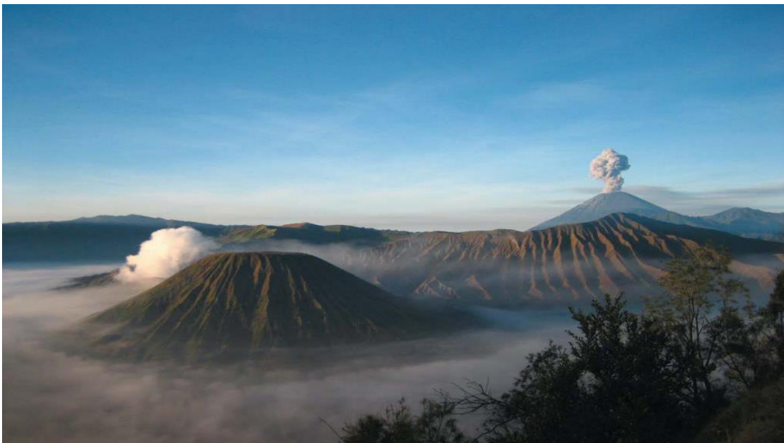
印尼著名的活火山—BROMO火山

印度尼西亚（以下简称印尼）位于亚洲东南部，由太平洋和印度洋之间的17508个大小岛屿组成，是世界上最大的岛国、最大的群岛国家，国土面积191.4万平方公里，海洋面积316.6万平方公里（不包括专属经济区）。包括苏门答腊岛、爪哇岛、苏拉威西岛以及婆罗洲和新几内亚的部分地区。与巴布亚新几内亚、东帝汶、马来西亚接壤，与泰国、新加坡、菲律宾、澳大利亚等国隔海相望。