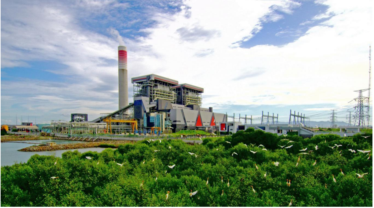
国华印尼爪哇7号项目